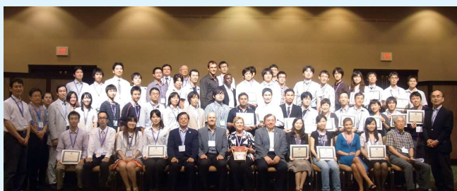
写真2 学生ポスター賞受賞者

ポスター賞表彰式と昼食会が盛大に開催された。一人ずつ名前を呼ばれ演台で表彰された後、受賞者が誇らし気に喜んでいる姿はたくましく、国際色豊かで世界の化学界の次世代のコアとなるであろうと感じた。展示会は日本化学会を含む64団体の出展があり、活況を呈していた。