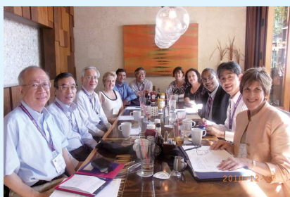
写真3 日・米化学会幹部メンバー

(株)日本旅行の事前登録・旅行受付並びに大会期間中の参加者対応は、組織委員会や化学会との連携を含めてスムーズであった。アブストラクトの登録も、本部で ScholarOne を採用したことを受けて、日本側でその提携先である杏林舎のサポートを受けた結果、順調に進んだ。