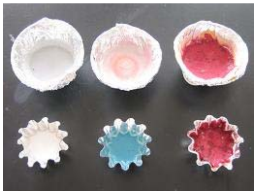
図2 左から尿素樹脂（白色）、フェノール樹脂（青色に着色）、レゾルシン樹脂（赤色） <color>

加熱をせず、臭いの発生を抑えた高分子合成実験 — 尿素樹脂、フェノール樹脂、レゾルシン樹脂の合成 峯岸 常之