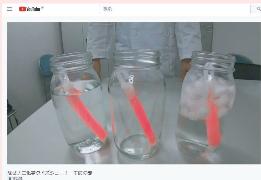
■視聴者による YouTube Live 画面例 (P494)