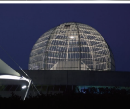
ガラス張りの建物。上から国立新美術館、東京国際フォーラム、葛西臨海水族園 (撮影：池田亜希子)