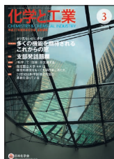
表紙：ガラス張りのビル群