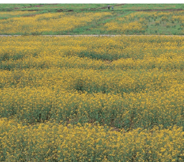
山梨県山中湖の菜の花