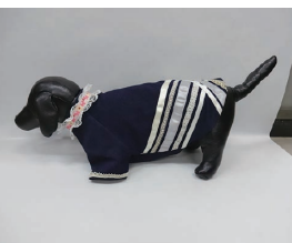
上から、いろいろな再 婦性反射材料とそれ を使った洋服