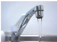
次亜塩素酸ナトリウム 5 水和物の結晶。水の殺菌が代表的な用途である