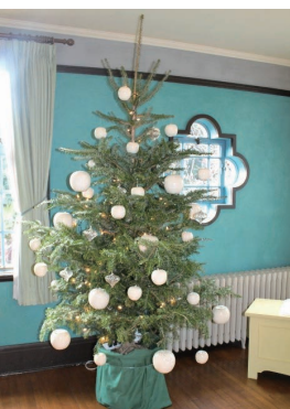
クリスマスの飾りつけ