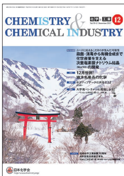
表紙:山形県湯殿山