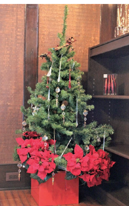
クリスマスの飾りつけ