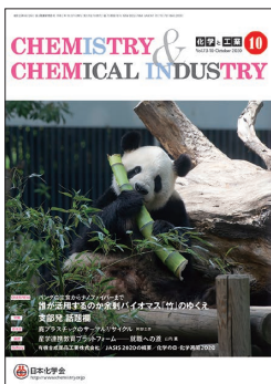
表紙：竹を食べるパンダ