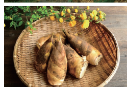
上から、じゃれ合うパンダ、竹林を通る小道、筍