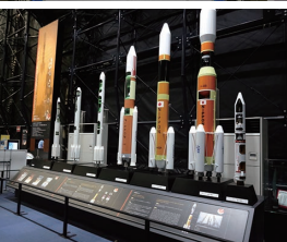
JAXA 筑波宇宙センター展示館（スペースドーム）にて。上から技術試験衛星「きく7号」「きぼう」実物大モデル内部、歴代ロケット模型