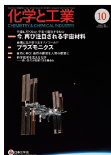
表紙：国際宇宙ステーション（提供：JAXA/NASA）