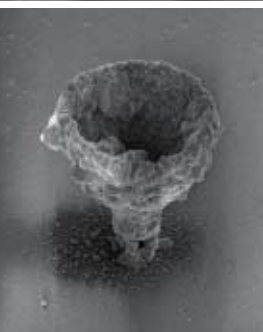
2光子還元法を用いて作製した3次元銀マイクロ構造