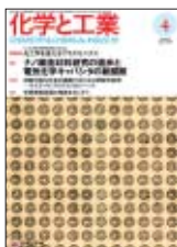
表紙：金で作ったメタマテリアル構造