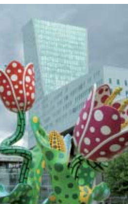
リール・ヨーロッパ駅前(フランス)「広場の花」