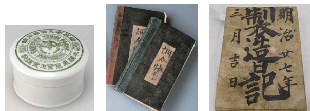
資生堂・福原衛生歯磨石鹸，花王・調合帳，ライオン・製造日記

ライオン関係資料としては，ライオン(株)が所蔵している石けんの製造開始初期の製造日記（1894 年），歯みがき事業開始初期の獅子印ライオン歯みがき粉（1899 年），英米輸出用桐箱入り歯みがき粉 Banzai（1905 年または翌年）を化学遺産に認定した。