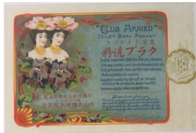
クラブコスメックス・クラブ洗粉

クラブ洗粉関係資料としては，(株)クラブコスメックスが所蔵しているクラブ洗粉紙袋（1906 年）を化学遺産に認定した。