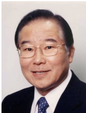
竜田 邦明 (たつた くにあき)

早稲田大学 荣誉フェロー・名誉教授。昭和 15 年生まれ。昭和 43 年慶應義塾大学大学院工学研究科博士課程修了(工学博士)。44 年同学助手, 60 年教授。平成 5 年早稲田大学大学院理工学研究科教授。23 年より現職。昭和 48 年ハーバード大学博士研究員。平成 22 年日本化学会副会長。受賞:日本化学会賞(平成 13 年), 紫綬褒章(平成 14 年), 藤原賞(平成 20 年), 日本学士院賞(平成 21 年), 日本化学会名誉会員(平成 22 年), アメリカ化学会アーネスト・ガンサー賞(平成 25 年)。専門:有機合成化学, 天然物化学。