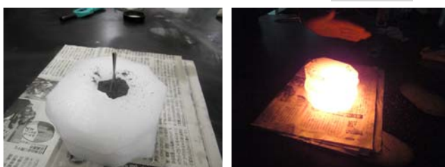
左：写真9 くぼみの広さは500円硬貨、深さは1cm程度あれば十分