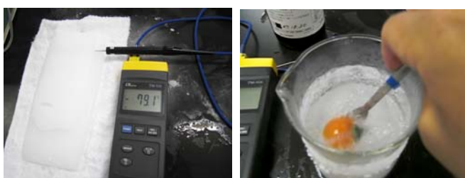
左：写真11 -78\sim-80^{\circ}\text{C} 台の数値が表示されている