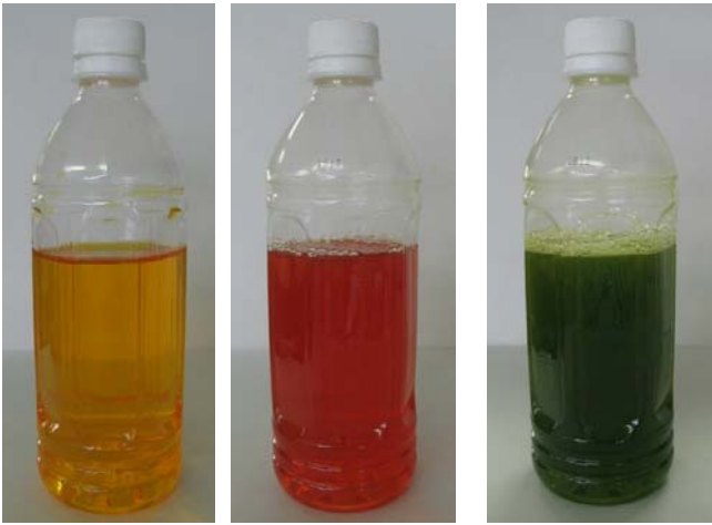
写真1 左から黄色、赤色、緑色