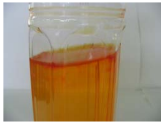
写真3 水面が赤くなる