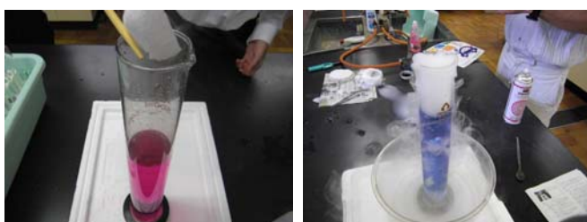
写真7,8 指示薬の色が数秒で変化する<color>