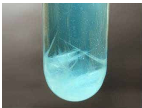
図3 硝酸カリウムの白色の針状結晶