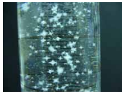
図5 塩化アンモニウムの結晶が析出する様子