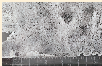
■生成した尿素結晶(ほぼ原寸大) (P287, 写真3)