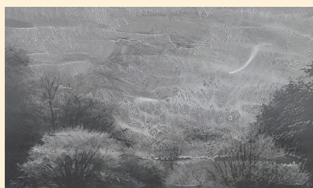
■尿素結晶の壁飾り (P287, 写真5)