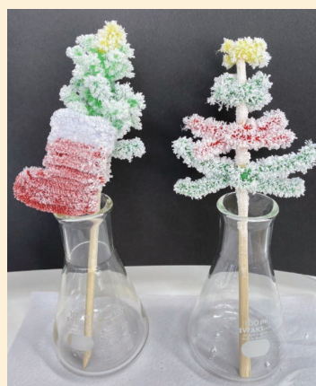
■尿素がモール表面へ析出する (P286, 写真2)