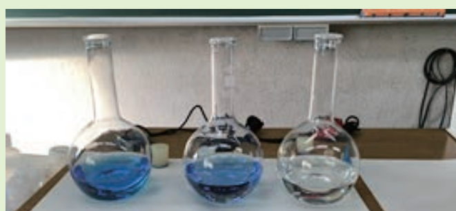
■ 丸底フラスコ内の様子 (P236, 写真 1) 左から (3), (2), (1) 濃度の大きい方から無色になる。