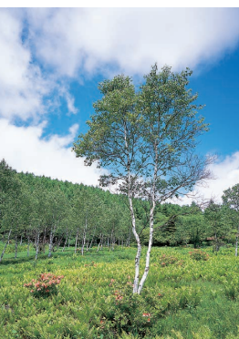
長野県富士見町入笠湿原