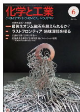
表紙：クリップを引き付けるネオジム磁石