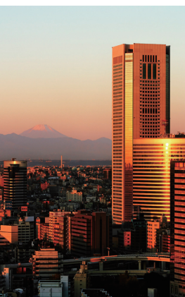
朝焼けの富士山