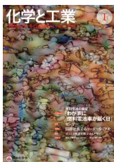
表紙： 燃料電池の金属セ パレーター表面画像 のカラージュ