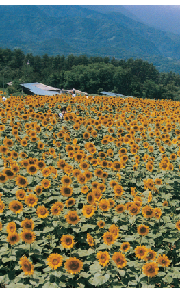
ひまわり

表紙： 中空糸膜構造の電子顕微鏡写真と取材地沖縄での写真のコラージュ