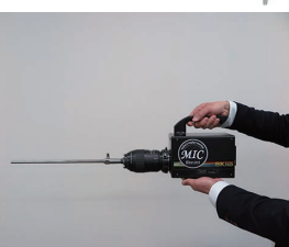
上から、4K テレビ「UD20」と4K 相当の映像を実現する「XL20」。手術で使われた、硬性鏡、視野拡大用レンズ、カメラヘッドからなる8K内視鏡