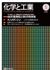
表紙：4K 相当の高精細映像を実現した「4原色」