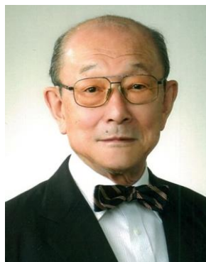
岩本 振武 (いわもと としたけ)

京都大学名誉教授。1941年生まれ。63年京都大学工学部燃料化学科卒業, 68年京都大学大学院工学研究科博士課程修了, 工学博士。同年同学助手。71~73年英国ロンドン大学インペリアルカレッジ(ラムゼーフェロー)。91年京都大学工学部教授, 96年同大学工学研究科教授, 2004年定年退官。05~12年岡山理科大学工学部教授。2000年日本化学会副会長。05~09年「化学と工業」誌編集委員長。08年化学遺産委員会委員長。受賞:有機合成化学協会賞(1983年), 日本化学会学術賞(1989年), 日本化学会フェロー(2009年)。専門:有機化学, 科学英語。