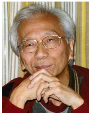
植村 榮 (うえむら さかえ)

京都大学名誉教授。1941年生まれ。63年京都大学工学部燃料化学科卒業, 68年京都大学大学院工学研究科博士課程修了, 工学博士。同年同学助手。71~73年英国ロンドン大学インペリアルカレッジ(ラムゼーフェロー)。91年京都大学工学部教授, 96年同大学工学研究科教授, 2004年定年退官。05~12年岡山理科大学工学部教授。2000年日本化学会副会長。05~09年「化学と工業」誌編集委員長。08年化学遺産委員会委員長。受賞:有機合成化学協会賞(1983年), 日本化学会学術賞(1989年), 日本化学会フェロー(2009年)。専門:有機化学, 科学英語。