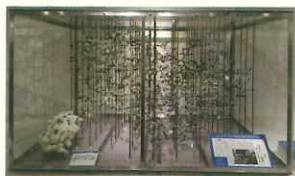
タカアミラーゼA 3次構造模型 左:パルサモデル(6Å) 右:ケンドリューモデル(3Å) (大阪大学総合学術博物館蔵)