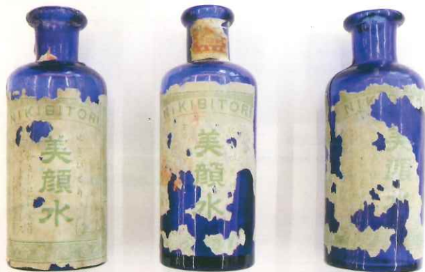
美顔水容器3点((株)桃谷順天館所蔵)

「美顔水」は、当初、医薬品として売り出され、現在でも医薬部外品の薬用化粧水として販売されている。医薬品は明治早々から規制が始まった。一方、化粧品の規制が始まるのは1900年売薬規制外製剤取締規則からである。それ以来、現在に至るまで化粧品は医薬品とともに安全性の面で厳しく規制されるとともに発展してきた。「美顔水」はそのような化粧品工業の方向に先んじた画期的な製品である。(株)桃谷順天館が所蔵する美顔水容器3点は、1885年発売当初の現存資料として貴重であり、化学遺産として認定する。