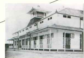
舎密局(本館)の写真