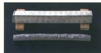
日満マグネシウム(株)宇部工場製 金属マグネシウムインゴットの初製品(前) 同社直江津工場製(後)