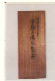
木箱の蓋 (ともに理化学研究所蔵)