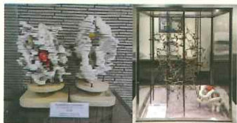
チトクロムc 3次構造模型 左:パルサモデル(4Å) (大阪大学蛋白質研究所蔵) 右:ケンドリューモデル(2.3Å) (大阪大学総合学術博物館蔵)

タンパク質分子の立体構造は、その機能を理解するために必要不可欠であるが、分子サイズが非常に大きく、高分解能の回折像を与える良質な結晶を得ることが難しかったため、20世紀半ばまでタンパク質の立体構造を決定できなかった。1958年にイギリスのケンドリュー(John.C.Kendrew, 1917-1997)らが世界で最初にミオグロビンの構造解析に成功したが、それは膨大な時間を要する困難な研究だった。日本で初めてタンパク質の構造解析に成功したのが、大阪大学蛋白質研究所の角戸正夫(1918-2005)らのグループである。彼らは、結晶作りから装置の開発、構造解析プログラムの開発など一連の作業や人材育成を研究所内で一貫して行い、カツオの還元型シトクロムcの構造について、1971年に分解能4Åでの解析、1973年には分解能2.3Åでの高分解能解析に成功した。これは世界で7種類目のタンパク質の構造解析であった。その後、タカアミラーゼAの構造解析を行い、1979年に低分解能の6Åで、1980年には高分解能の3Åで成功した。大阪大学の総合学術博物館と蛋白質研究所に保存されている構造模型4件は、その研究の際に作られたもので日本のタンパク質の構造研究のレベルの高さを示す記念碑的な一次資料であり、化学遺産として認定する。